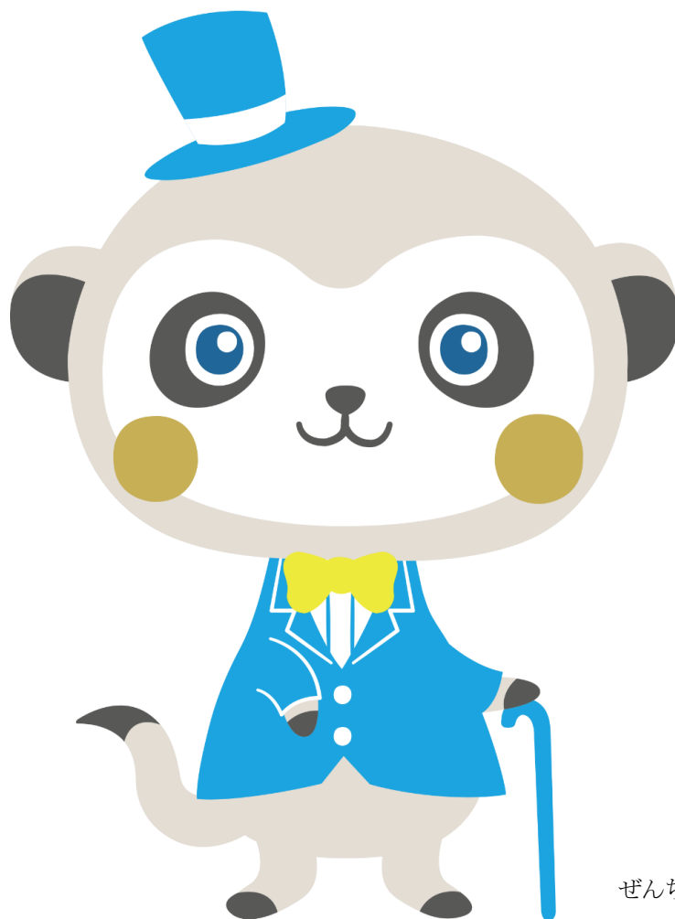
ぜんち共済キャラクター 「ぜん太」